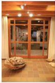
Detail zum Bereich „Museum“ mit Infrastruktur